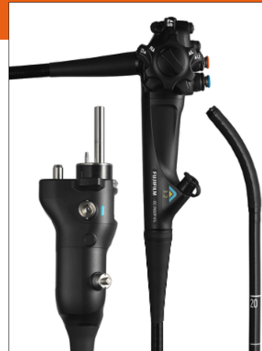
Código de referencia: EC-740T/L