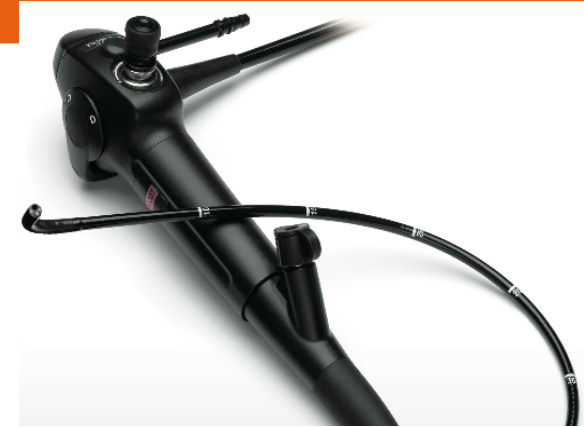
Código de Referencia: ER-530T