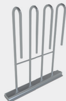
Soporte para balón