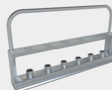
Soporte para tráqueas (hasta 36 unidades)